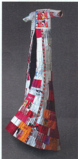
Japanisches Müllkleid, 2009, ca. 180 cm, Plastikverpackungen, Garn. © Patricia Thoma

Im Atelier hängt eine Art Stoffgebilde, an dem Patricia zu arbeiten scheint. Arbeitet sie zurzeit auch frei als bildende Künstlerin? »Eigentlich komme ich aus der freien Kunst und wechsle die Projekte, mal etwas im Kinderbuchbereich, mal sind es freie Arbeiten. Was dort hängt ist eine Robe, an der ich arbeite. In all den Ländern, in denen ich war, habe ich jeweils den Müll und Papiere gesammelt. Eigentlich nachhaltiges Material, das hoch ästhetisch ist. Daraus nähe ich Roben, die nicht als figurbetonte Mode fungieren, sondern sehr groß und störrisch sind. Studierende des zeitgenössischen Tanzes verwendeten sie für ihre Choreografien. Die Roben sind wie eine große Zeichnung und sie machen Geräusche, wenn man sich mit ihnen bewegt. Oft gehen sie bei den Performances auch kaputt, es hat also auch etwas Brutales und erzeugt extreme Emotionen. Bei meinen freien Arbeiten ist es ganz ähnlich wie bei den Bilderbüchern: Jeder kann sich das daraus mitnehmen, was für ihn passt, was er oder sie mitnehmen möchte.«