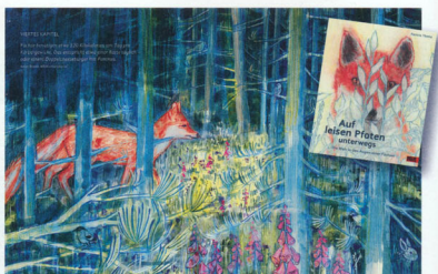
Ich finde es wichtig, Kinder für Farben zu sensibilisieren.« Ill. aus »Auf leisen Pfoten unterwegs« (Beltz & Gelberg)

Im Bilderbuch »Auf leisen Pfoten« folgt die Betrachtende einer Füchsin bei der Aufzucht ihrer Jungen und durch ihren Alltag zwischen Natur und Stadt. Sowohl sprachlich als auch visuell findet die Künstlerin gleichermaßen einen realistischen und poetischen Stil. Bleistift-puren, die den Zeichenprozess offenbaren sind auf den angefügten Zeichnungen am Ende des Buches erkennbar. »Es soll sichtbar sein, wie die Zeichnungen entstanden sind, sodass Kinder selbst auf die Idee kommen zu zeichnen.« Im großen Atelier-Zimmer steht kein Computer. Arbeitet die Künstlerin komplett analog? »Viele arbeiten jetzt digital und das hat wirklich viele Vorteile. Aber ich sitze sowieso so viel am Rechner, sodass ich mich freue, wenn ich einen Bleistift in der Hand habe. Ich möchte, dass sichtbar ist, dass das analog gemacht ist.«